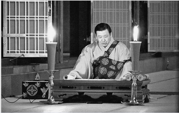
11月25日 「御伝鈔」 拝読