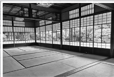
りんちてい 【臨池亭】 収容人数20名程度