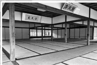
ろうふうてい 【嵐風亭】 収容人数80名程度