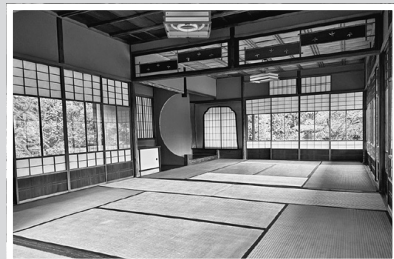
てきすいしん 【滴翠軒】 収容人数20名程度