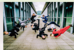
MORTAL COMBAT ブレイキン