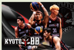
KYOTO BB 3x3 バスケットボール

パリ五輪で話題の「ブレイキン」、2本のなわとび「ダブルダッチ」、東京五輪でも競技になった「3X3バスケットボール」の無料体験会とエキシビジョンマッチ&パフォーマンスを開催! 今話題のアーバンスポーツをアツク楽しもう!