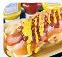
upit's Burger ホットドッグ

※ツリークライミングは各回先着で小学生10名、中学生以上3名まで。すべての回の分を8月31日の朝9時から緑地帯南側の現場で受け付けます。定員に達し次第締め切りとなります。