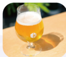
京都醸造 クラフトビール (31日のみ)