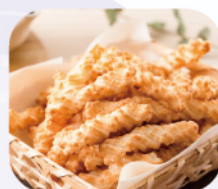
天狗製菓 横綱あられ