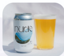
KYOTO NUDE BREWERY クラフトビール