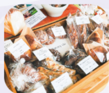
ホテルカンラ京都 ドリンク・軽食