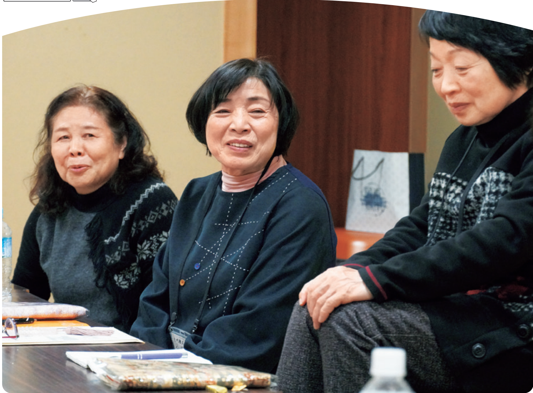
真宗本廟奉仕での座談会