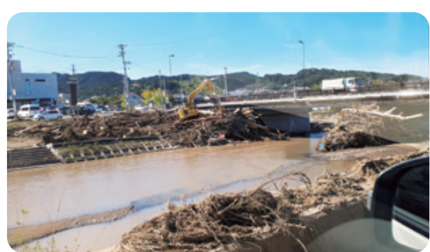
多くの土砂が流れついた

残念なことですが、地域の状態がこれ以上そんなによくなることはないのではないかと思ひます。地震も余震がまだ続いていますし、その上豪雨災害もあつて、そのうちみんな心が折れてしまうだろうと思ひます。本当はもう折れているのかもしれないです。