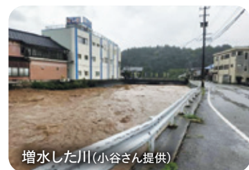
増水した川

てるんですよ。全然外に出られない状態で、その時はとにかく自分のことで精一杯でした。そして、市役所に電話して、「すみません、助けてください」と伝えて、その後連絡はありませんでした。でも、4日目に社会福祉協議会の人から、生存確認の電話はかかってきました。地震が起きるまでは何か備えをしなればと一生懸命考えていたけど、今はその時に逃げれば何とかなる、いのちを守る