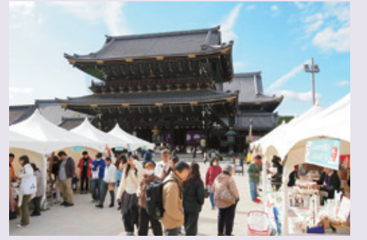
東本願寺 能登半島地震復興応援ひろば

「能登節」の伝承者として広く活動を続けてきた。当日は能登教区ボランティア委員会から能登教区の現状報告も行われ、目の前の現実に向き合い、今後も活動を続けていきたいと語られた。その後廣陵氏による節談説教が2席あり、会場では、来聴者の笑いと涙、そして話を受けて「南無阿弥陀仏」と念仏される姿が見られた。