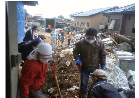
東日本大震災における海楽寺さまでの宗派による支援活動(2011.4)

これまでの災害では、地元市区町村の社会福祉協議会により、現地に「災害ボランティアセンター」が開設されました。家屋の清掃や家財の運び出しなど、ボランティアの協力を得たい時は相談しましょう。また、弁護士などの専門家が相談窓口を開設したり、企業が物資を提供したり、NPOが「避難所の環境改善」「子どもや要配慮者の見守り」「重機を使った土砂などの撤去」といった専門的支援を行ったりします。